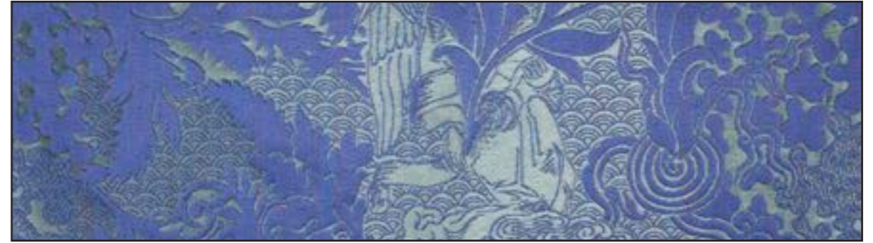
79632 Electric 001