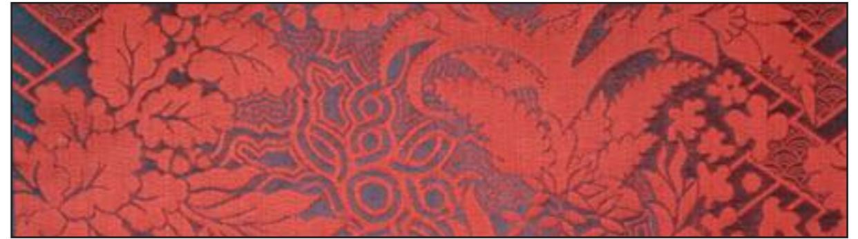
79632 Feu 002