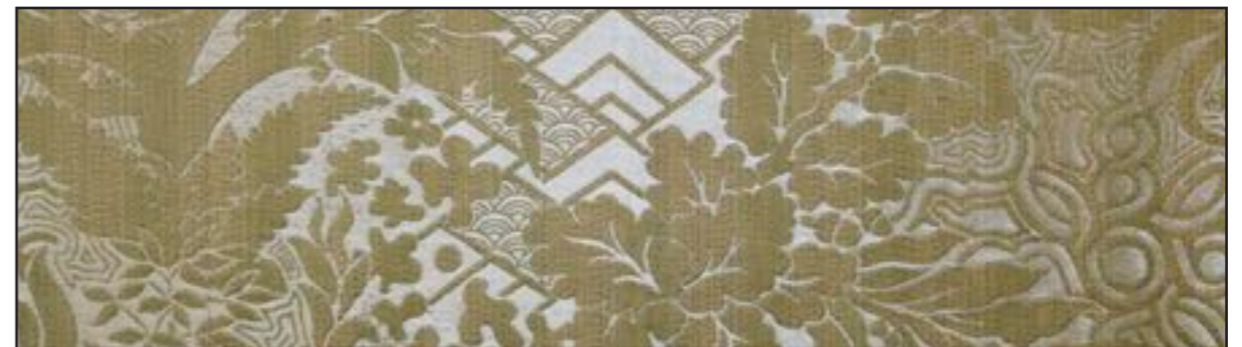
79632 Eclair 104