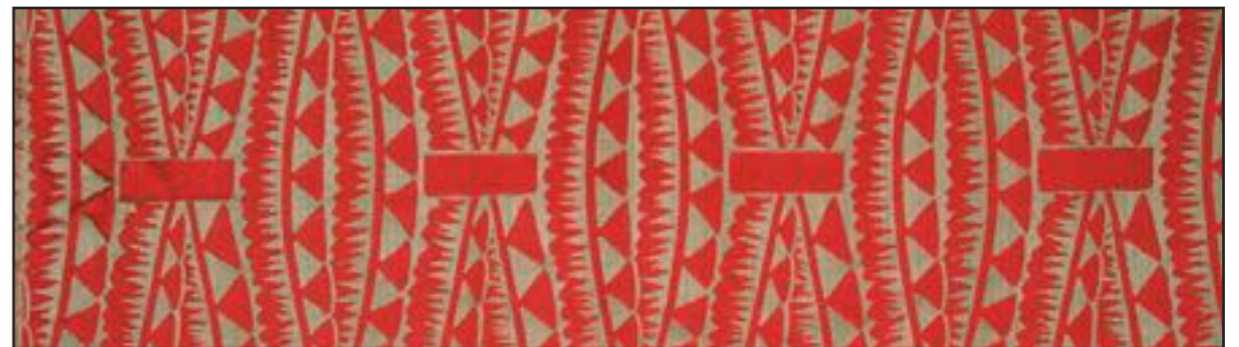
87396 Toucan 104