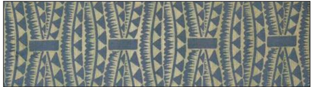
87396 Calao 004