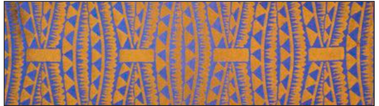
87396 Starling 001