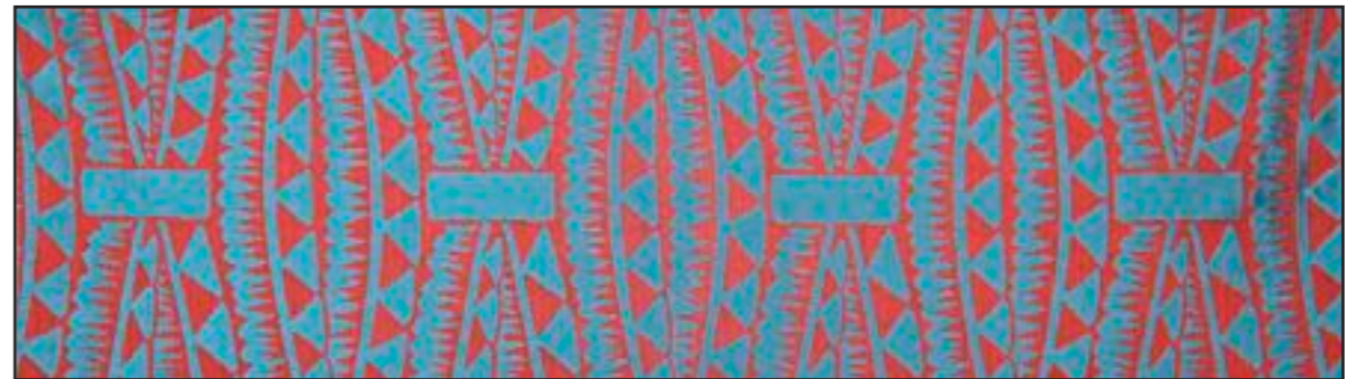
87396 Ara 002