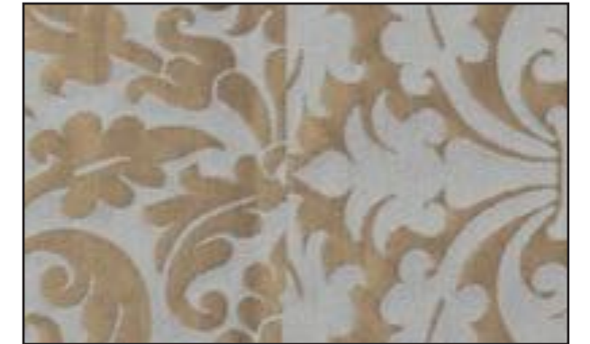
89611 Clair de lune 107