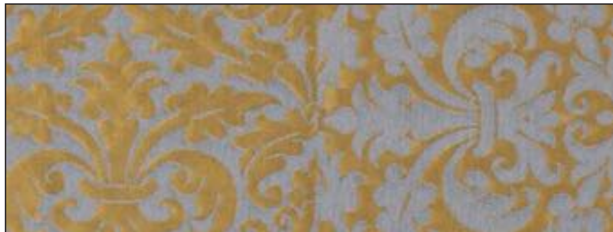
89611 Avant la pluie 001