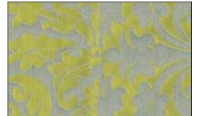
89611 Sous-bois 201