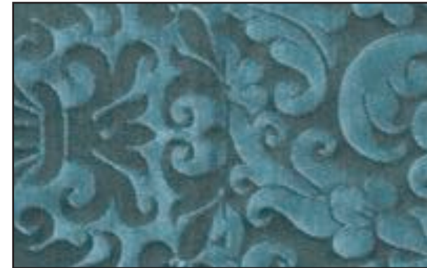
89611 Ciel de mousson 101