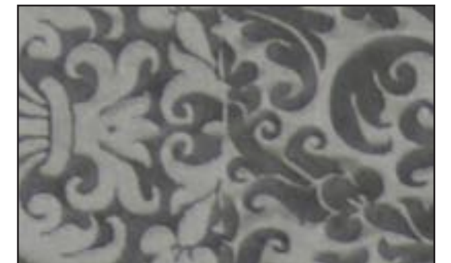
89611 Tempête 401