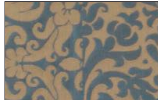
89611 Ciel d'orage 108