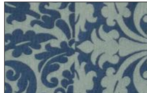
89611 Nuit d'encre 301