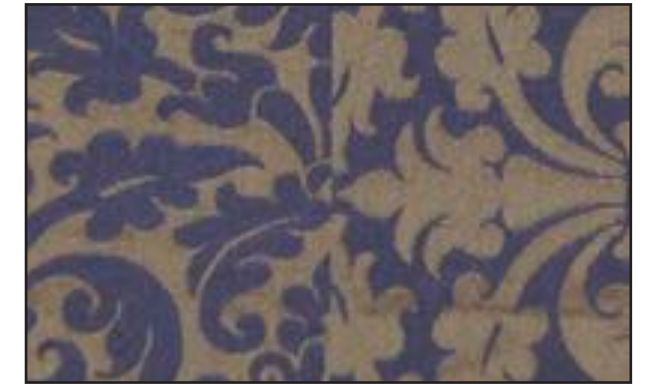
89611 Crépuscule 008