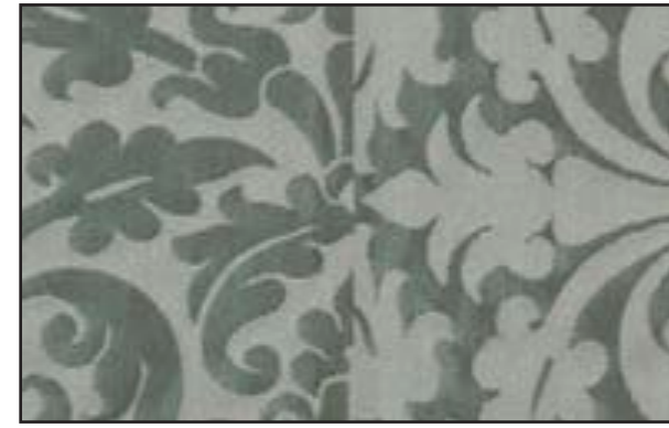
89611 Ciel de plomb 007