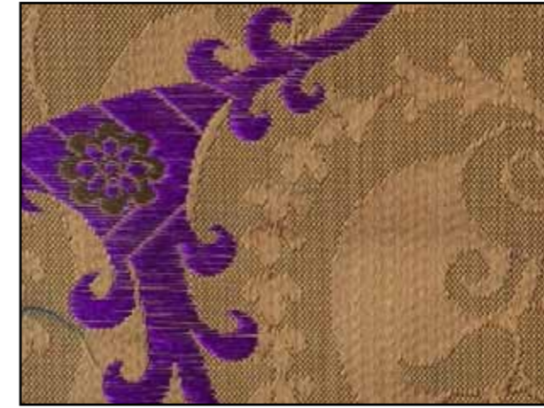
69641 Cognac 03

Width of the fabric : 128 cm / 50.39" Height of Repeat : 26 cm / 10.24" Quality : cotton 60% silk 40% Period : Renaissance