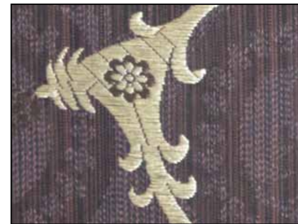
69641 Ebène 08