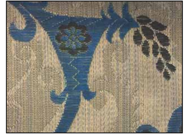
69641 Vert de gris 04