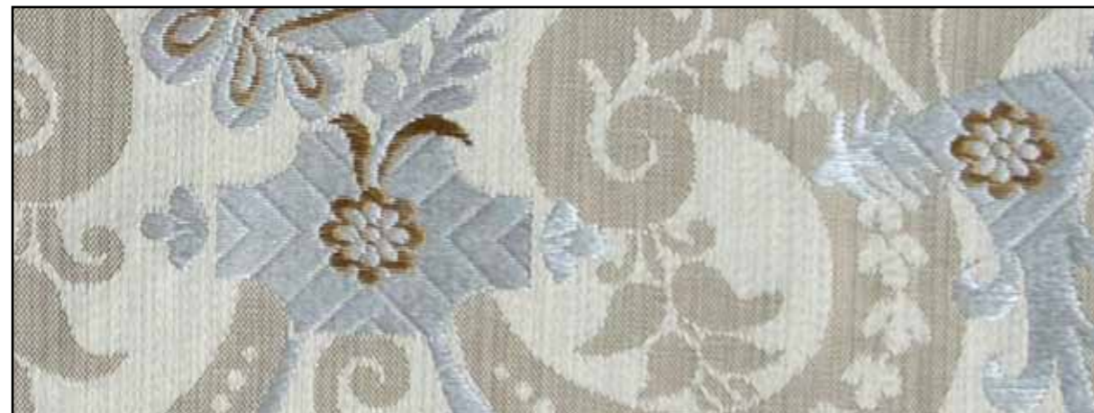
69641 Crème 05