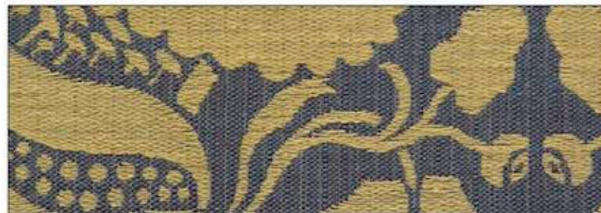
69687 Cascade 008