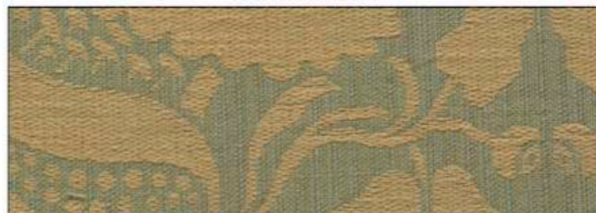
69687 Bosquet 104

LA MANUFACTURE PRELLE Soieries à Lyon depuis 1752