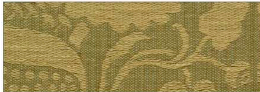
69687 Buis 004

LA MANUFACTURE PRELLE Soieries à Lyon depuis 1752