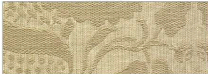
69687 Biche 005