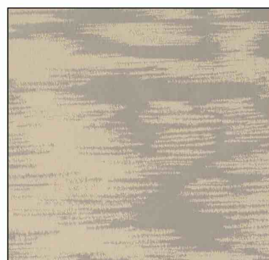
89668 Coquillage 005

LA MANUFACTURE PRELLE Soieries à Lyon depuis 1752