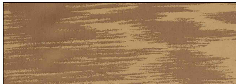
89668 Jonc 008