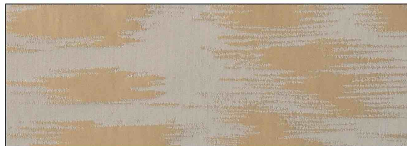
89668 Siène 007

LA MANUFACTURE PRELLE Soieries à Lyon depuis 1752