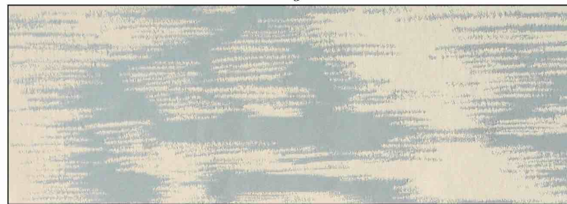
89668 Naiade 105

LA MANUFACTURE PRELLE Soieries à Lyon depuis 1752