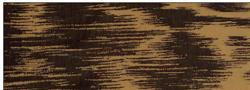
89668 Abyssin 100