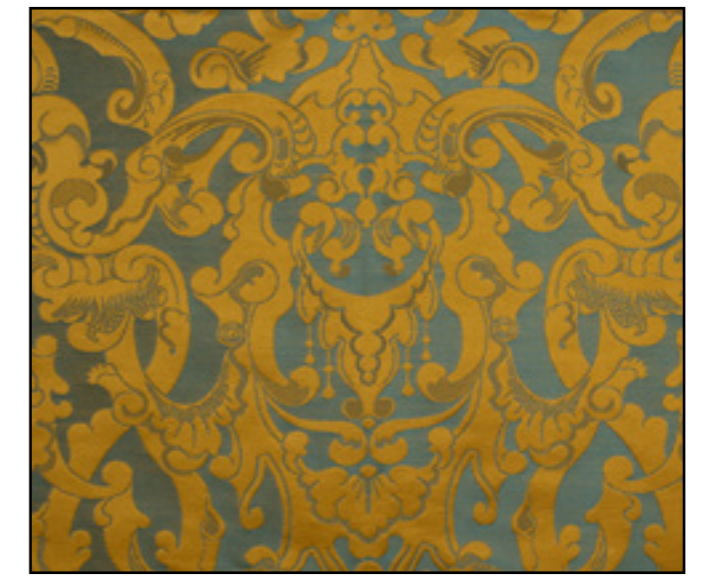
64216 003 Eclair