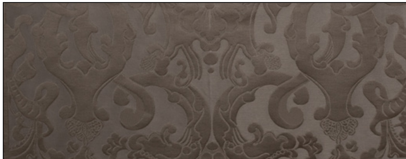
64216 105 Chantilly