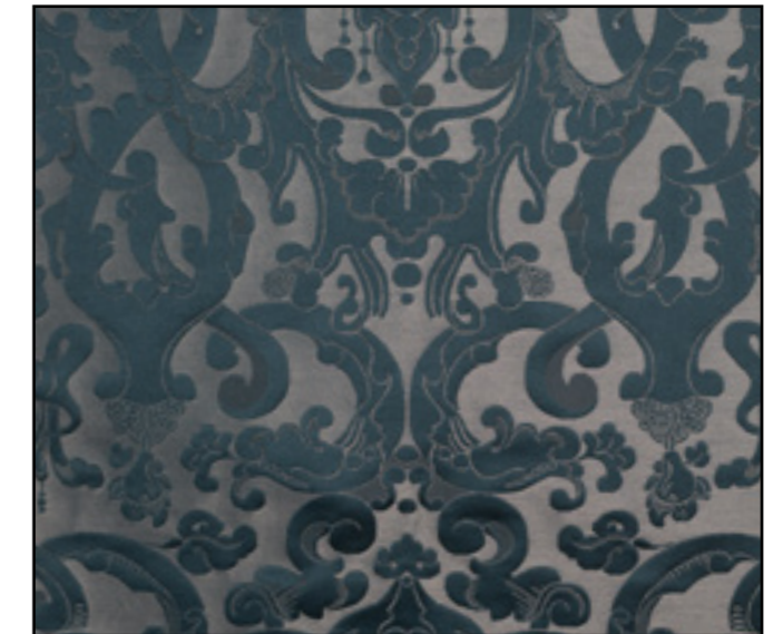
64216 001 Myrtille