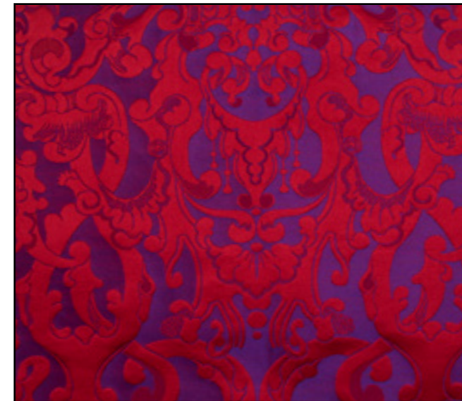
64216 002 Praline