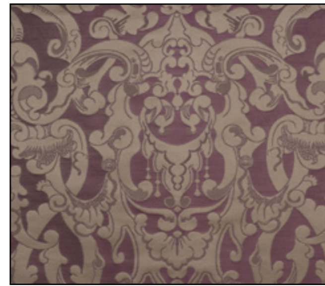
64216 005 Violettes

Largueur 128 cm / 50.4" Width Hauteur du raccord 69 cm / 27.17" Height of the repeat Qualité Lin/Linen 58% Soie/Silk 42% Quality Période Louis Philippe Period