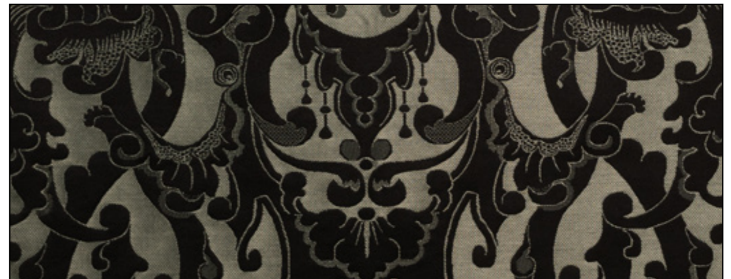
64216 100 Pistache